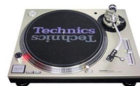
SL 1200 MK5