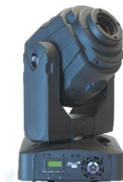
MAX SPOT 500