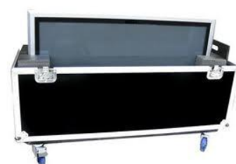
Téléviseur + flight